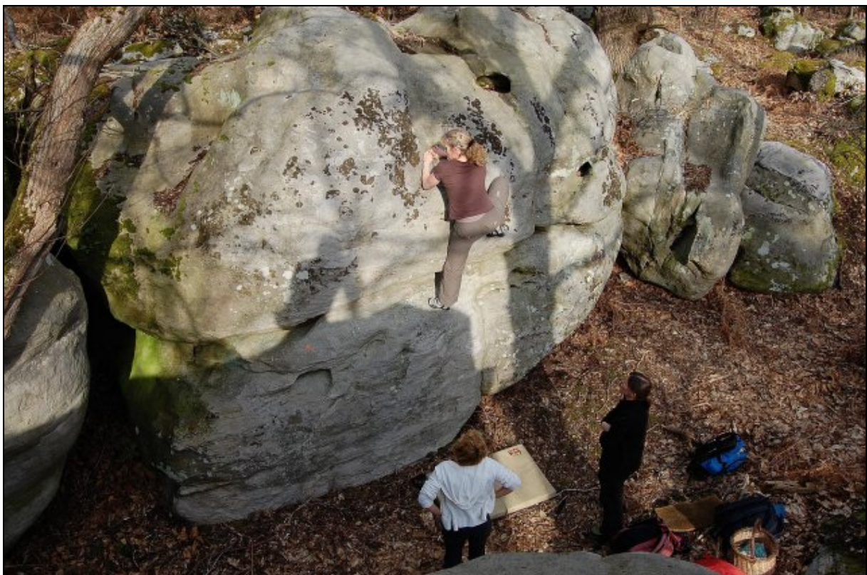
~Le sandwich~ 14bis orange - Martine Bultel